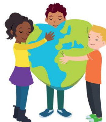
We hebben hart voor elkaar

Om met elkaar over gevoelens te praten, is het van belang dat de kinderen zich veilig voelen in de groep; tegelijkertijd bevorderen deze gesprekken de veiligheid in de groep. Er ontstaat een vertrouwde sfeer. We hebben het over gevoelens als boos en verdriet. We bespreken wat het betekent als iemand wordt buitengesloten. De kinderen leren herkennen wat hen boos maakt en hoe ze hun boosheid uiten. Ze leren dat "afkoelen" belangrijk is om een conflict te kunnen oplossen. Verder gaat het in blok 4 over blij zijn, tevreden zijn, over opkomen voor elkaar.